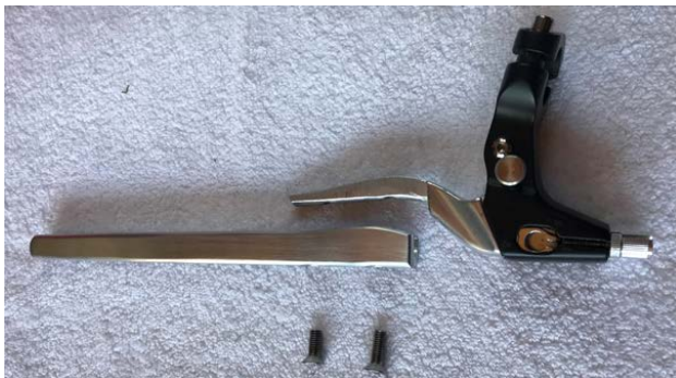
Der neue Kniebremshebel in seinen Einzelteilen

Die Bremshebelverlängerung wird aus einem Al-Rechteckprofil 20 mm x 15 mm geschnitzt, im wahrsten Sinn des Wortes. Mit einer Minidrill wird eine Ausfräsung in die Hebelverlängerung so eingebracht, dass der (abgefeilte) Bremshebel dort genau hinein passt und angeschraubt werden kann. Die äußere Form an den ursprünglichen Hebel angepasst, fertig. Was hier schnell geschrieben steht, dauert in Wirklichkeit einige Stunden mit Minidrill, Feile und Schleifsteinen.